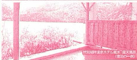
然別湖畔温泉ホテル風水(露天風呂) (宿泊の一部)

2泊目 知床ウトロ温泉 ホテル知床 開放感のある露天風呂で知床の自然を お楽しみ。